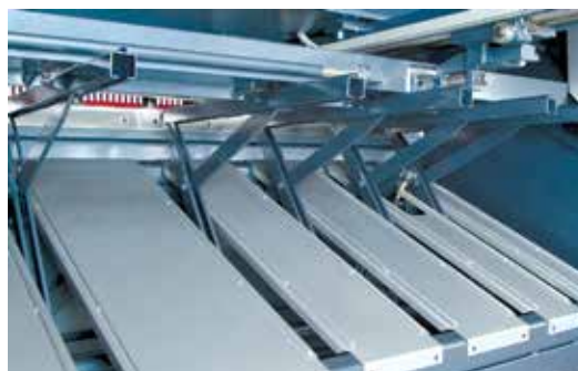
Sostegno lamiera posteriore pneumatico (optional)