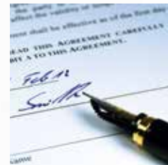
Contratti di assistenza