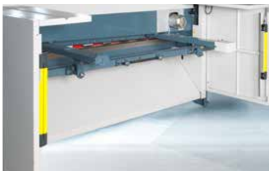
Barriere fotoelettriche posteriori