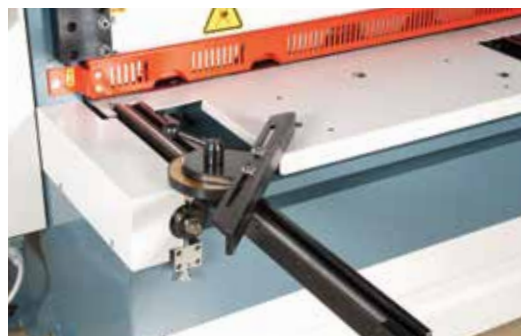
Goniometro regolabile 0-180° per tagli inclinati (optional)

Il sistema di trasmissione GECKO –DURMA, compatto e ad elevate prestazioni, è dotato di frizione a secco e freni magnetici che consentono di gestire partenza, arresto, posizionamento e relative regolazioni necessarie. Privo di gioco, cicli di funzionamento con coppie elevate in presa diretta. Non necessita di manutenzione.