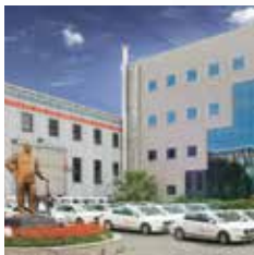
Servizio post vendita